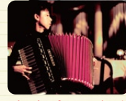
※シルク・ルミエール イメージ